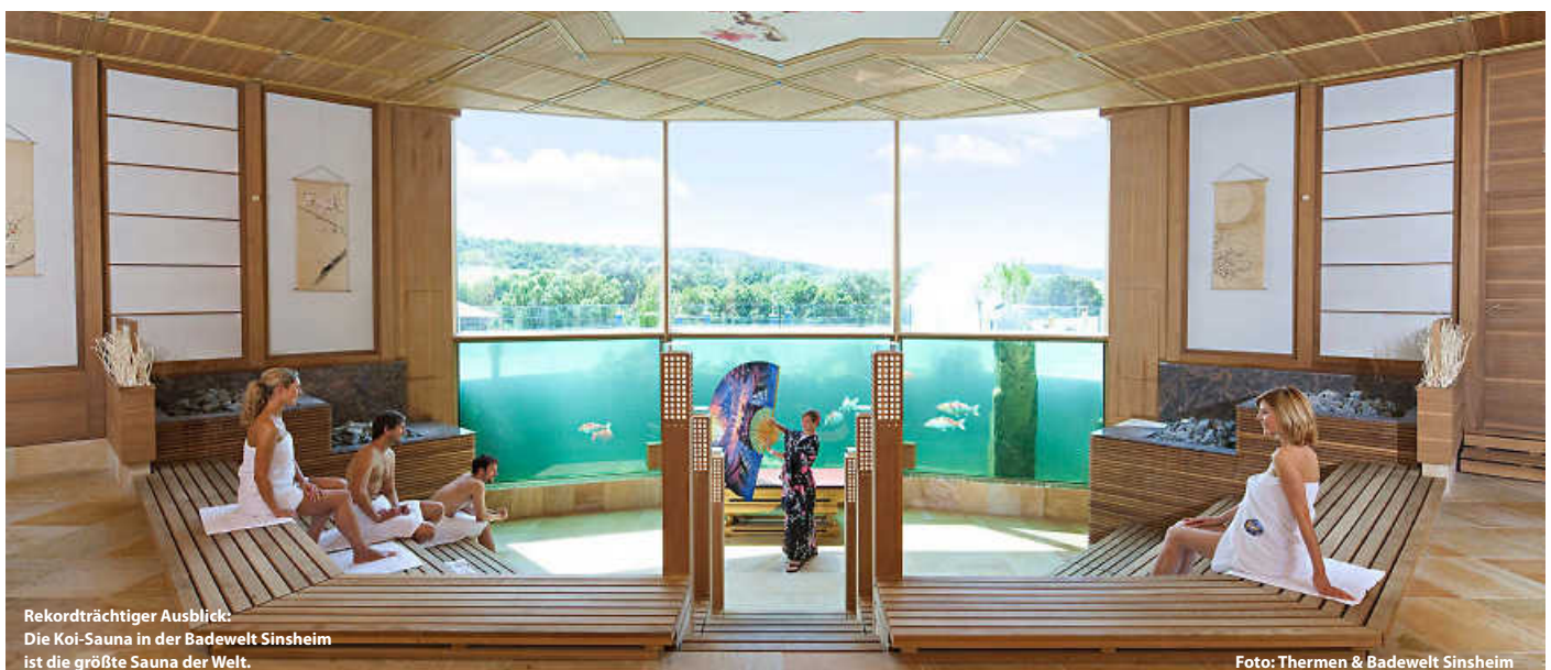
Rekordträchtiger Ausblick: Die Koi-Sauna in der Badewelt Sinsheim ist die größte Sauna der Welt.