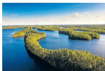
Bildvortrag über Finnland bei der VHS Öhringen am 2. März