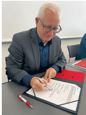
Erster Landesbeamter Gotthard Wirth unterzeichnet die Absichtserklärung

Am Dienstag, 7. Februar 2023, findet von 14:00 Uhr – 16:30 Uhr in der Aula der Akademie für Landbau und Hauswirtschaft in Kupferzell der jährliche Informations- und Gesprächsnachmit-