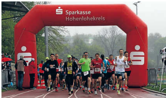
Das war der Stadtlauf 2022 – 2023 geht es in die nächste Runde – hoffentlich mit viel Sonnenschein

Am Sonntag, den 23. April 2023 um 11.00 Uhr fällt im Otto-Meister-Stadion der erste Startschuss zum 29. Öhringer Stadtlauf entlang des Limes, durch das ehemalige Gelände der Landesgartenschau und durch die Öhringer Innenstadt.