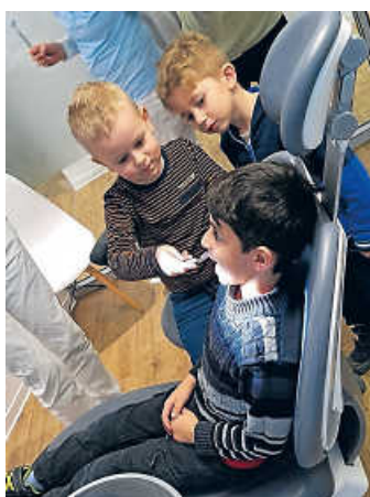
Eine praxisnahe Einführung in den Beruf des Zahnarztes bekamen die Vorschulkinder des Kindergartens Limespark