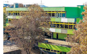
Info-Nachmittag am 14. Februar in der Öhringer Realschule

Die Realschule Öhringen – eine traditionsreiche, anerkannte Schule – lädt Viertklässler und deren Eltern zu einem Informationsnachmittag ein. Am Dienstag, 14. Februar 2023 heißt die Realschule alle Besucher herzlich willkommen. Durch einen Rundgang, begleitet durch Neuntklässler, erhalten sie Einblicke in den Fachunterricht und die Fachräume, in das soziale Profil der Realschule und in den Wahlpflichtbereich Technik, AES (Alltagskultur, Ernährung und Soziales) und Französisch. Auch der bilinguale Zug – das zweisprachige, exklusive Profil der Realschule Öhringen – stellt sich vor. Die Viertklässler können bei unterschiedlichen Angeboten mitmachen und Fachunterricht an der RSÖ selbst erfahren. Treffpunkt für interessierte Eltern und Schüler ist um 14.15 Uhr am Haupteingang der Realschule, Schülerlotsen zeigen den Weg. Der Rundgang endet gegen 15.45 Uhr. Aufgrund der geringen Parkmöglichkeiten direkt an der RSÖ wird die Nutzung der Parkplätze am Hallenbad empfohlen.