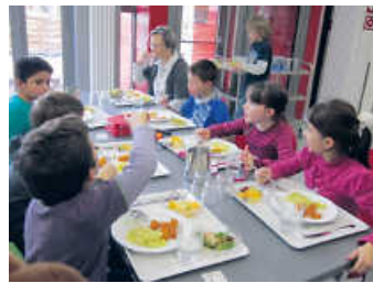
Mensaessen in der Schillerschule

Die Lieferung der Mittagsverpflegung für die städtischen Kindertageseinrichtungen Rosenberg und Limespark (LOS 1) sowie die Schillerschule, Hungerfeldschule und August-Weygang-Gemeinschaftsschule (LOS 2) wurde nach Ausschreibung an die BBT Gruppe Region Tauberfranken-Hohenlohe zum Angebotspreis von 342.177,44 Euro (LOS 1) und 640.597,30 Euro (LOS 2) für vier Jahre Laufzeit vergeben. Das Essen kann somit in der Küche des Hohenloher Krankenhauses zubereitet werden. Das hat der Gemeinderat am 24. Januar beschlossen. Die Abwicklung des Bestell- und Abrechnungsprozesses wurde an die Kitafino GmbH, Nürnberg vergeben. Hier wird eine Buchungsgebühr von 0,25 Euro pro Essen berechnet.