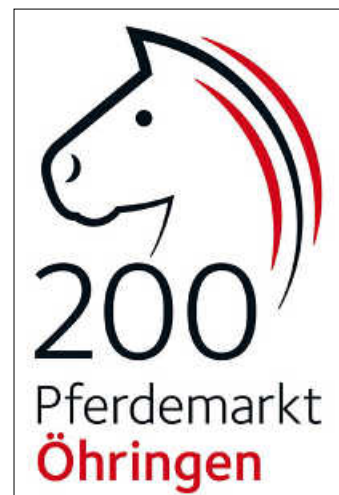
Öhringen feiert 200 Jahre Pferdemarkt

Dieses Jahr feiert der „höchste Öhringer Feiertag“ am Sonntag, 19. Februar und Montag, 20. Februar, seinen 200. Geburtstag. Traditionell besuchen den Pferdemarkt Tausende Besucher aus nah und fern. Der Öhringer Pferdemarkt wurde erstmals am 4. Februar 1823 als „Öhringer Roßmarkt“ auf königlichen Beschluss durchgeführt. Im Wandel der Zeit entwickelte er sich zu einem Veranstaltungsmagneten, der jeweils am dritten Montag im