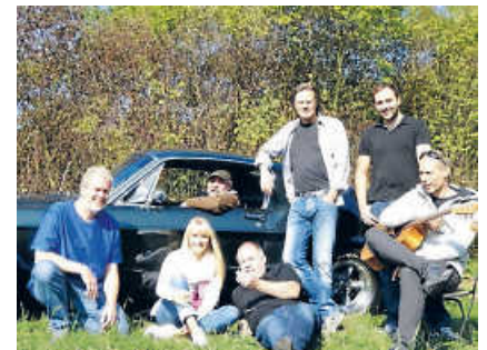
Sell & Jenes - Akustik Covers mal ganz anders!

Ihre Bewerbung können Sie bis zum 28.02.2023 an doppeltleben@podium-esslingen.de senden. Die Ergebnisse werden im Herbst 2023 im Rahmen des von TRAFO veranstalteten Ideenkongresses zu „Kultur, Alltag und Politik auf dem Land“ auf die Bühne gebracht.