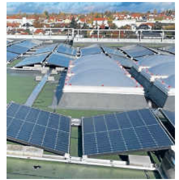
Photovoltaik-Anlage auf der Realschule

Mit Solarzellen ausgestattet werden sollen von den Öhringer Stadtwerken im Jahr 2023 noch das Hallenbad, die August-Weygang-Gemeinschaftsschule und das Hohenlohe-Gymnasium Öhringen.