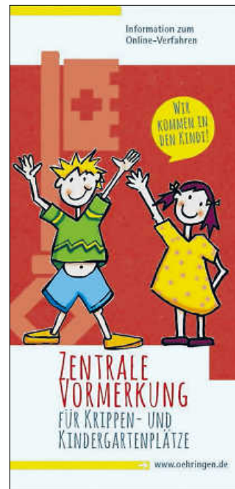
Sie brauchen einen Kita-Platz? Nutzen Sie das bequeme Online-Verfahren zur Vormerkung

Nach der Registrierung können alle Daten und die gewünschten Betreuungseinrichtungen angegeben werden. Aufgrund der Kindergartenferien erfolgt im Juli und August keine Aufnahme. Bitte geben Sie hier den 1. September als gewünschtes Aufnahmedatum an. Bei der Vormerkung für einen Krippen- oder Ganztagesplatz ist eine aktuelle Arbeitgeberbescheinigung erforderlich. Den Vordruck hierzu finden Sie ebenfalls online in der Vormerkung sowie auf der Homepage der Stadt Öhringen.