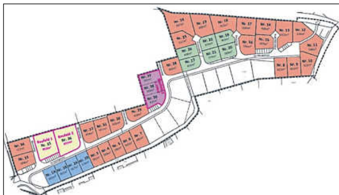
Im Neubaugebiet „Göckes I“ in Michelbach sind 32 Bauplätze zu vergeben