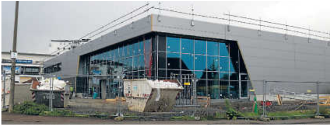
Der Neubau in der Berliner Straße