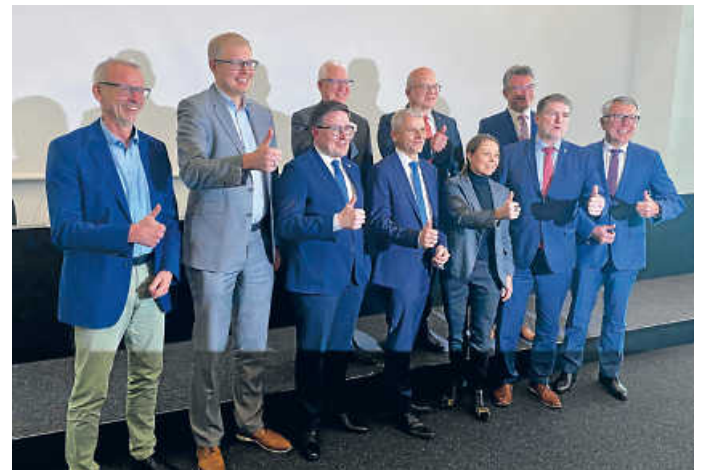
Strahlende Gesichter der Kooperationspartner