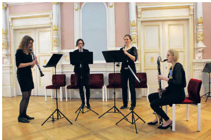
Musikerinnen beim letzten Kammerkonzert der Stadtkapelle im Jahr 2019