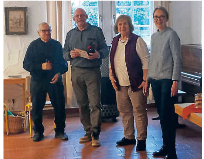
Bei der Vortragsreihe Öhringen um 1930

auf der Gedenkmünze? „Ja der alt guat Gaascht wäht alleweil no z'Ähringe“, ja der alt guat Gaascht, der isch bei uns dahoam“. Vielen Dank für die tolle Vorführung!